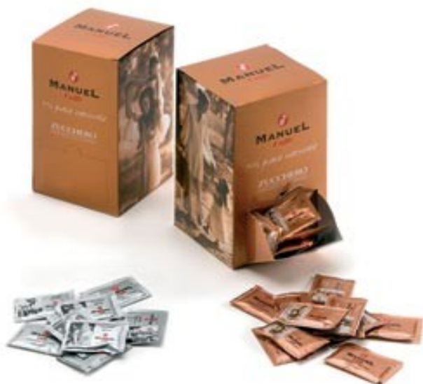
Zahar alb & brun