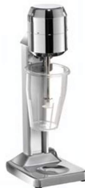
Mixer Milkshake T2