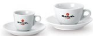
Model Avorio 80 cc / 180cc