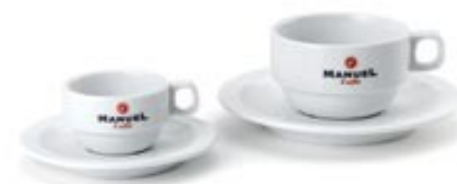
Model Acapulco 80 cc / 210cc