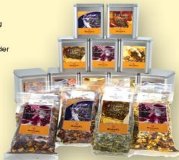
Pungi de 200 gr.

Ceai negru Earl Grey Ceai negru Darjeeling Breakfast Special Jasmine Ceai verde Gunpowder Rosa d'Inverno Rooibos Bourbon Menta Menta Verbena Marrakech Mint Fructe de padure Copacabana Lamale Mar Portocale rosii Afine Cirese Capsuni Kiwi Fuoco di Camino Sogno d'Amore Moulin Rouge Scortisoara Migdale Vanilie Piersica Zmeura Twilight Notti in Tibet