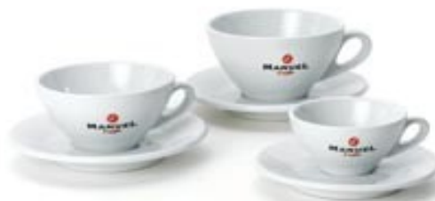
Model Cromo 80 cc / 180cc / 230cc