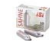
Capsule sifon 1 L 10 buc