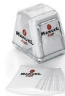
10 x 14 x 13 cm